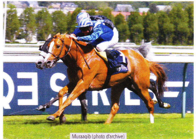
Muraaqib (photo d'archive)

un bon poulain récent deuxième des Jebel Ali Racecourse Za'abeel International Stakes (Gr1 PA) à Newbury, pour le même entraînement et la même casaque.